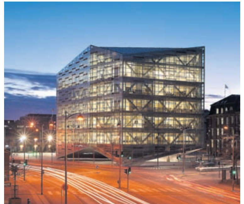
Kristallinn þykir falla einstaklega vel inn í umhverfið við Kalvebod Brygge.

Byggingin hefur vakið mikla athygli innan og utan Danmerkur og þykir falla einstaklega vel inn í umhverfið við höfnina, auk þess að vera meistaralega hönnuð. Burðarvirkið er stálgrind, hönnuð af Gunnari, og eitt af því sem