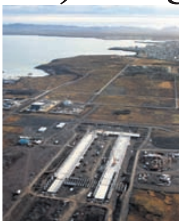
HELGUVÍK Orka úr fyrirhugaðri Hverahlíðarvirkjun yrði seld til álvers Norðuráls í Helguvík.

KPMG hefur þegar kynnt stjórn OR hvernig ráðast mætti í gerð virkjunarinnar með því að stofna