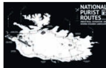
Verkefnið gengur út frá því að settar yrðu upp vetnisstöðvar um allt land í tengslum við áhugaverða staði og starfsemi.